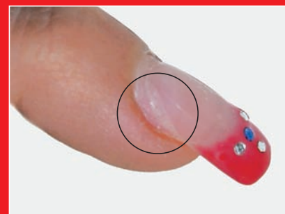
Produktlifting und Verletzung des Nagelfalzes durch Kratzen oder Nagen

An den Längsseiten der Nägel dringt die Nagelplatte tief in den lateralen (seitlichen) Nagelfalz ein. Diese Furche, die den Nagel U-förmig umgibt, bestimmt die Nagelbreite und schützt das Nagelbett vor dem Eindringen von Schmutz und Keimen. Die tiefe Seite dieser Falte ist mit einer mehrschichtigen Deckhaut ausgestattet, die ein geschmeidiges Keratin produziert,