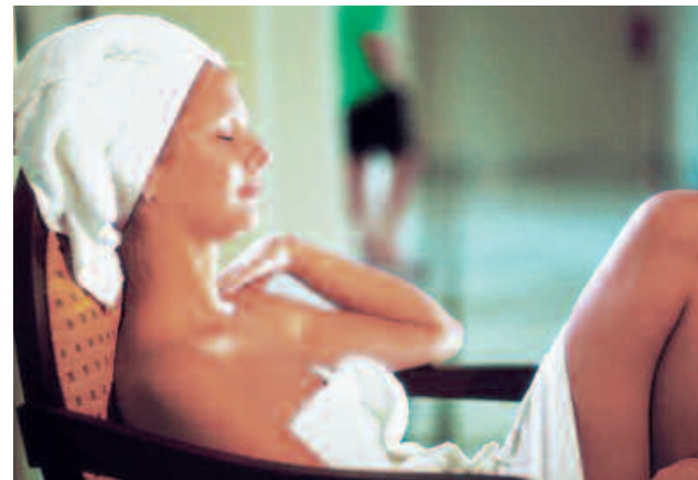
Von Thalasso bis hin zu physiotherapeutischen Behandlungen – im Wellness Center ist für jeden Geschmack etwas dabei