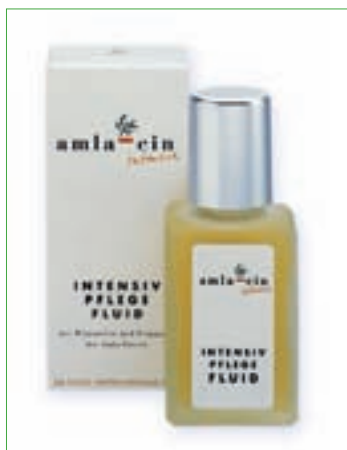
amla-cin® Intensive Intensivpflege Fluid

Laboratoires Cosmedic GmbH Nussbaumallee 8 50169 Kerpen, Germany Tel.-Nr. ++49-2237-973260 Fax: ++49-2237-973326-23 E-Mail: info@amlacin.de Internet: http://www.amlacin.de