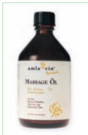
amla-cin® Ayurvedic Tri-Dosa-ÖL