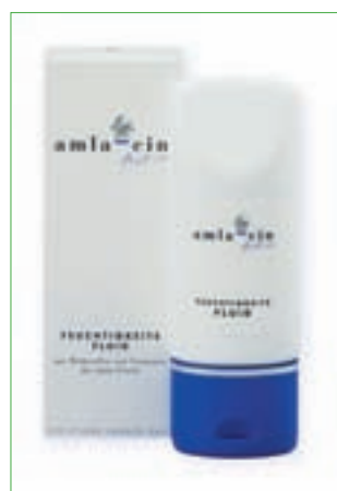
amla-cin® Active Feuchtigkeitsfluid